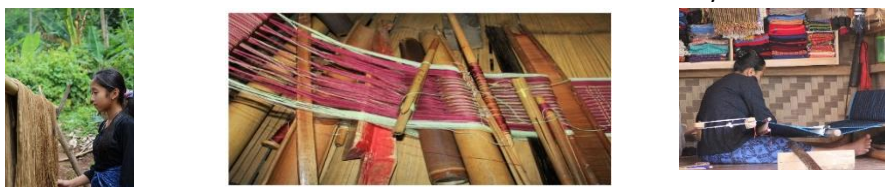
Gambar 2. Proses Pembuatan Kain Tenun Baduy

Setelah proses penjemuran benang, didiamkan sejenak, sebelum proses penenunan. Untuk penenunan dilakukan dengan anyaman