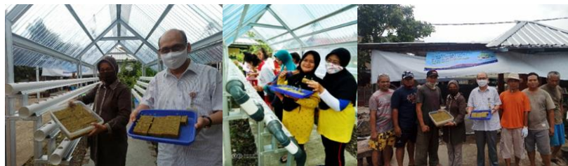
Gambar 5. Praktek Penanaman Bibit Sayuran Hasil Penyemaian