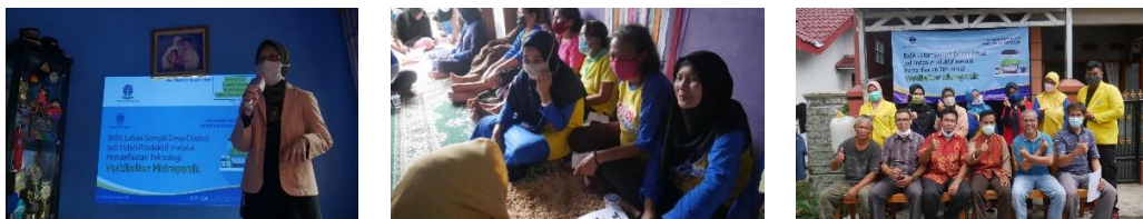
Gambar 3. Sosialisasi PkM

Sesi pertama dilaksanakan di kediaman ketua RT 07 pada tanggal 28 September 2020, berupa ceramah dan diskusi sosialisasi program kerja dan pemberian motivasi kepada 48 warga belajar mengenai program-program yang akan dilaksanakan. Sosialisasi dan motivasi dilakukan secara langsung oleh tim program Pengabdian kepada Masyarakat (PkM) bekerjasama dengan ketua RT 07 dan ketua RW 09 Desa Cilebut Barat. Pada kegiatan ini, masyarakat atau warga belajar diberi motivasi dan penyadaran mengenai pentingnya menyiasati lahan sempit yang kurang mendapat perhatian dan tidak dimanfaatkan secara optimal. Selain itu, diberikan juga materi tentang seluk beluk teknik menanam sayuran secara vertikutur hidroponik. Diikuti penyajian materi terkait dengan peluang wirausaha dengan konsep ekonomi kreatif. Tayangan contoh cara dan hasil-hasil penanaman sayuran dengan cara vertikutur hidroponik ditampilkan secara visual, dengan menampilkan power point atau video. Yang menggembirakan selain warga belajar, juga hadir ketua RT, ketua RW dan beberapa tokoh setempat sebagai bentuk dukungan secara moril.