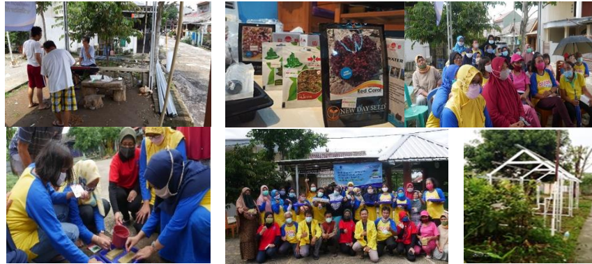
Gambar 4. Persiapan Lokasi dan Praktik Penyemaian