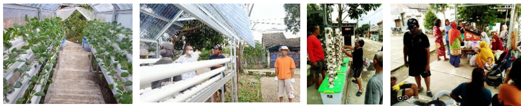
Gambar 7. Persiapan Lokasi dan Praktik Penyemaian

Sebagai bentuk pertanggungjawaban kegiatan, tim PkM melihat keadaan pasca pelatihan, pada tanggal 12 November 2020. Wadah vertikultur hidroponik terlihat masih rapi putih bersih, kontras dengan warna sayuran yang menghijau. Kegairahan warga meningkat dengan melakukan panen bersama unsur Desa, RW, dan RT setempat, yakni suatu ide kebersamaan yang patut dibanggakan.