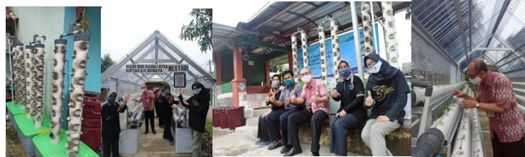
Gambar 6. Persiapan Lokasi dan Praktik Penyemaian