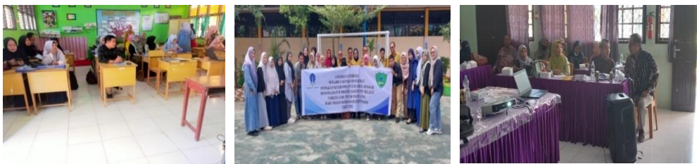
Gambar 2. Laman Guru Pintar Online