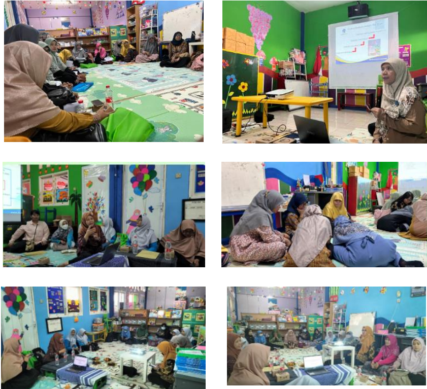
Gambar 3. Foto-Foto Kegiatan Pelatihan