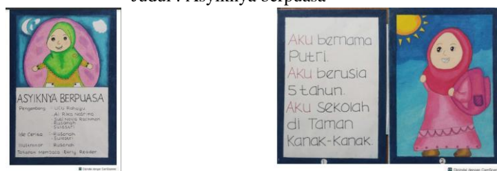
Gambar 4. Contoh Tampilan Big Book Tema Kita Semua Bersaudara dan Judul : Asyiknya berpuasa

Pada kegiatan PkM ini dihasilkan 5 buah big book dari lima kelompok peserta. Tema big book yang dihasilkan adalah (1) Kelompok 1 : Kita semua bersaudara, (2) Kelompok 2 : Tema: Aku Sayang Bumi dan Judul: Si Daun Hebat , (3) Kelompok 3 : Tema : Kita Semua Bersaudara dan Judul : Cika Senang Berbagi, (4) Kelompok 4 : Tema: Kita Semua Bersaudara dan Judul : Asyiknya berpuasa, dan (5) Kelompok 5 : Tema: Aku Sayang Bumi dan Judul : Rumah Budi Kebanjiran. Contoh bentuk big book yang dihasilkan adalah sebagai berikut.