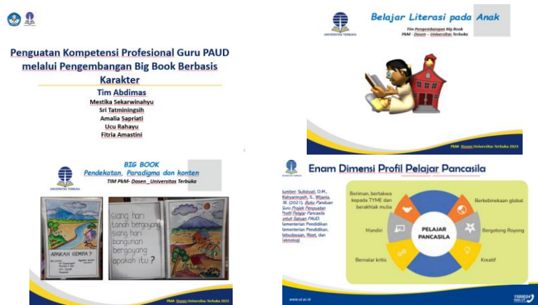
Gambar 2. Bahan-Bahan Pelatihan