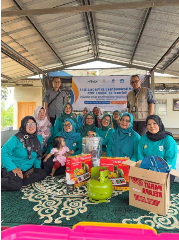
Gambar 3. Koordinasi dan Sosialisasi dengan Perangkat Desa