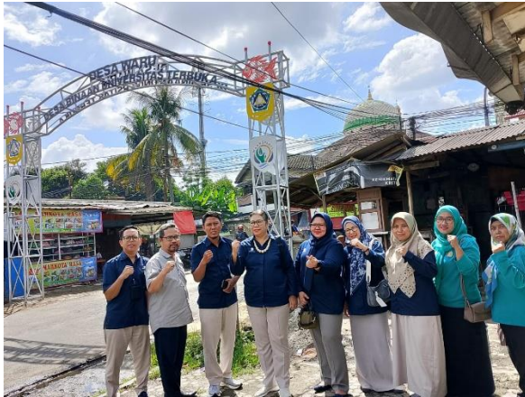
Gambar 1. Gapura Desa Waru

Gapura ini Adalah hasil dari pemberi bantuan tim PKM Nasional untuk Desa Waru.