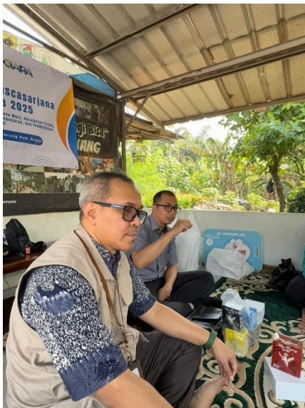
Gambar 2. Penyerahan Alat dan Pelatihan

Gapura ini Adalah hasil dari pemberi bantuan tim PKM Nasional untuk Desa Waru.