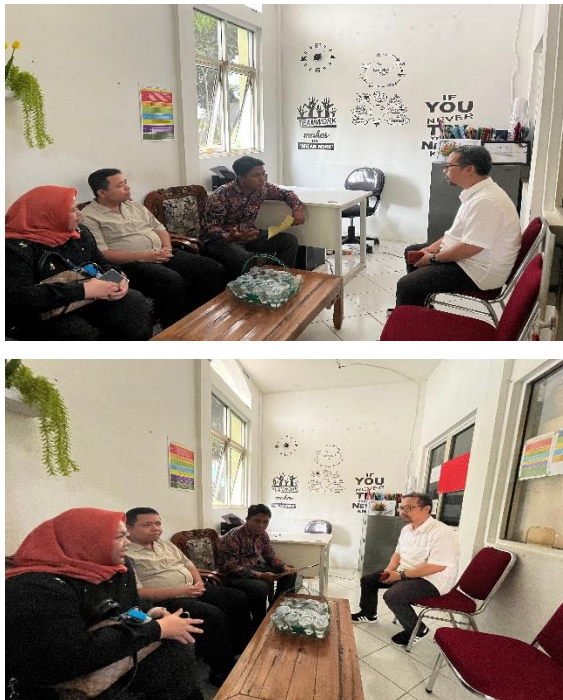
Gambar 1. Observasi Awal Tim Pelaksana PkM SPS

Desa Waru, Kecamatan Parung, Bogor, merupakan wilayah yang memiliki potensi besar untuk pengembangan sektor ekonomi lokal melalui Usaha Mikro, Kecil, dan Menengah (UMKM). Komoditas lokal seperti pengolahan Black Garlic, kripik pisang, pengolahan hasil pertanian dan perikanan air tawar, dan produk kuliner tradisional menjadi kekuatan utama yang dapat dioptimalkan untuk meningkatkan perekonomian desa. Namun, potensi ini belum sepenuhnya dimanfaatkan akibat sejumlah tantangan yang dihadapi oleh pelaku UMKM di Desa Waru. Berdasarkan observasi dan wawancara awal dengan kepala desa dan sekretaris Desa Waru diperoleh informasi sebagai berikut: