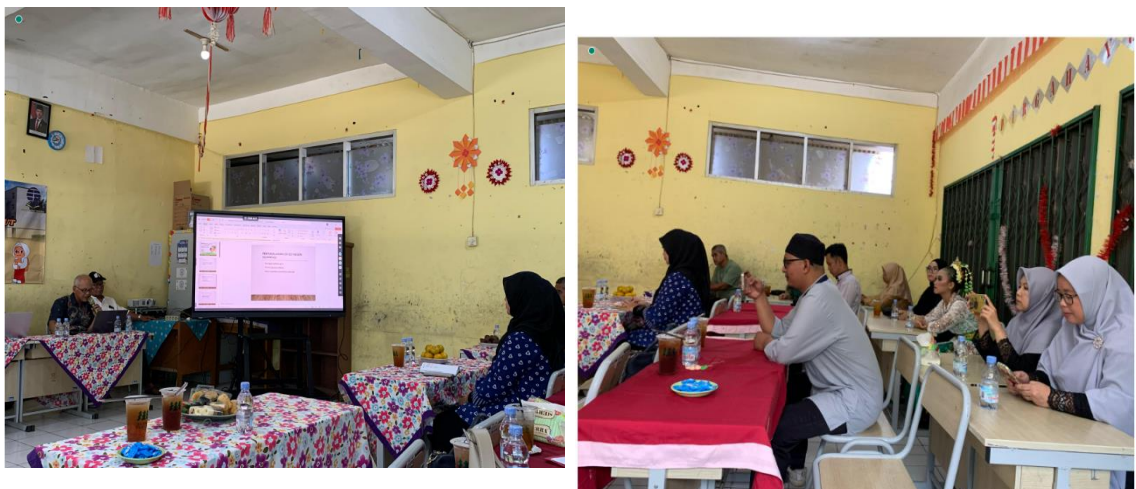
Gambar 2. Pelaksanaan FGD

Permasalahan yang ada di SDN Siliwangi disampaikan oleh salah satu guru dan operator. Minat pendapat atau solusi. Dewan guru berharap pada murid agar