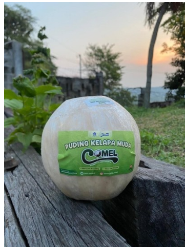
Gambar 2. Bentuk Hasil Jadi dari Puding Kelapa Muda COMEL

sensasi otentik, nilai estetika yang tinggi, dan citra ramah lingkungan yang membedakan "COMEL" dari produk puding kelapa lainnya di pasaran.