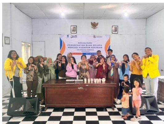
Gambar 3. Kegiatan Pelatihan Pemanfaatan Kelapa Muda menjadi Puding Kelapa Muda

Pelaksanaan sosialisasi dan pelatihan produksi yang diadakan di Balai Desa Kalongan menunjukkan tingkat antusiasme yang tinggi dari masyarakat, khususnya kelompok ibu-ibu PKK dan karang taruna. Model pelatihan yang dirancang dengan alokasi 80% praktik dan 20% teori terbukti sangat efektif dalam proses alih keterampilan ( transfer skills ). Pengamatan selama pelatihan menunjukkan bahwa peserta tidak hanya memahami konsep (20% teori), tetapi yang lebih penting, mereka mampu dan percaya diri dalam menguasai eksekusi (80% praktik). Hal ini mengindikasikan bahwa untuk keterampilan teknis pengolahan pangan, model yang berfokus pada praktik langsung jauh lebih unggul daripada metode ceramah konvensional.