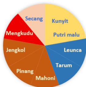
Gambar 1. Diagram Hasil Pewarnaan Kain Tenun dengan Pewarna Alami (Mukhooyaroh dkk., 2023)