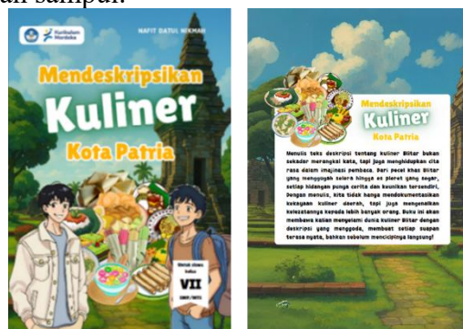
Gambar 3 Desain Akhir Sampul Bahan Ajar

Tahap ini dilakukan pengembangan bahan ajar secara utuh dengan menggabungkan materi, ilustrasi, teks, dan latihan pada layout dengan bantuan aplikasi Canva hingga produk yang dikembangkan menjadi bahan ajar yang siap untuk divalidasi. Berikut ini adalah salah satu hasil akhir pengembangan bahan ajar menulis teks deskripsi bertema kuliner Blitar pada bagian sampul.