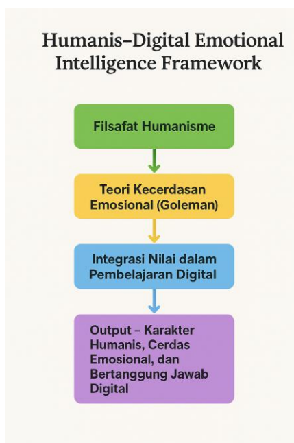
Gambar 2. Visualisasi Model Humanis–Digital Emotional Intelligence Framework