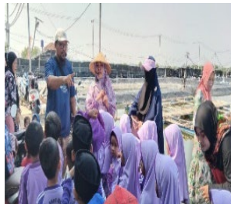
Motivasi anak dari nelayan sukses di tambak