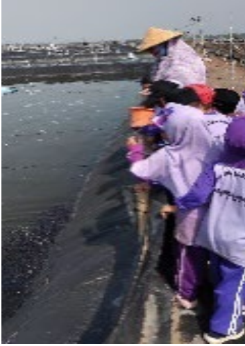
Gambar#<Kegiatan kunjungan ke tambak modern>