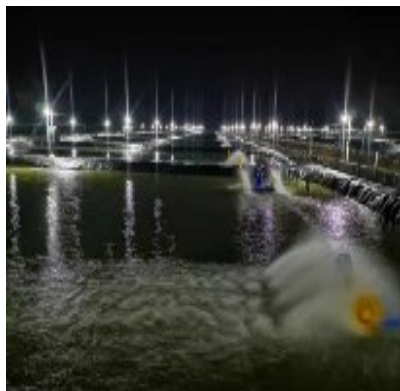
Situasi malam hari tambak modern